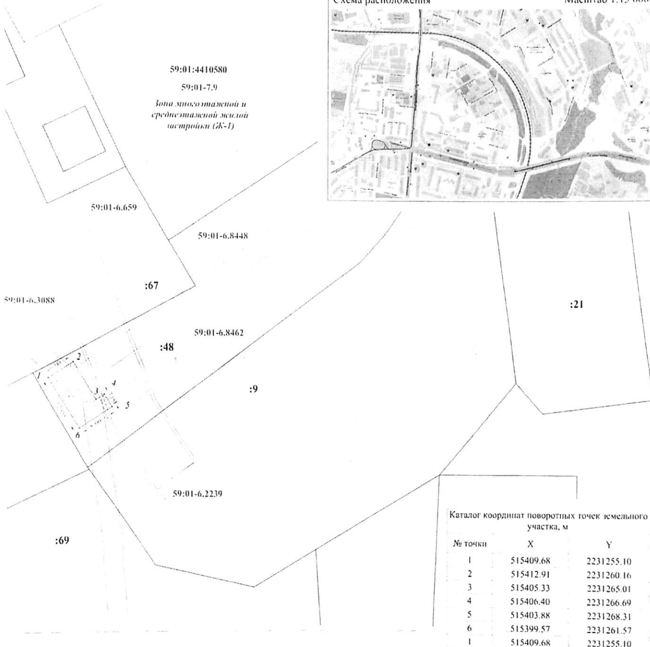
Каталог координат поворотных точек земельного участка, м